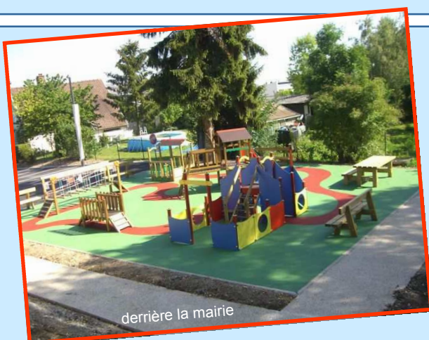
derrière la mairie

M algré un début de journée arrosée, la fête du 19 juin a connu une belle participation. Le nouvel emplacement des manèges a permis d'étendre la réderie et la restauration a pu vous proposer un bel espace convivial. Nous avons dégusté du jambon à la broche au son des musiques péruviennes du groupe Sicuani. Grâce à Amiens Rollers, de nombreux enfants se sont initiés aux joies du patinage. Les tournois de tennis de table et de pétanque ont séduit adultes et