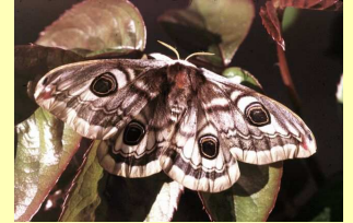
Petit paon de nuit

Il faut signaler à la Police que le parking derrière la Mairie est accessible pour les contrôles le soir. Prévoir une inauguration en septembre du square ludique. Vote : à l'unanimité.