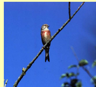
Mâle de linotte mélodieuse