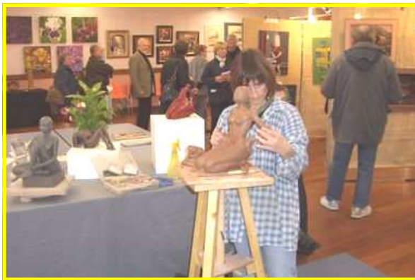
Merci aux quelques 800 visiteurs

Merci aux saints fuscienois qui sont venus nous rejoindre.