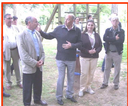
De gauche à droite :