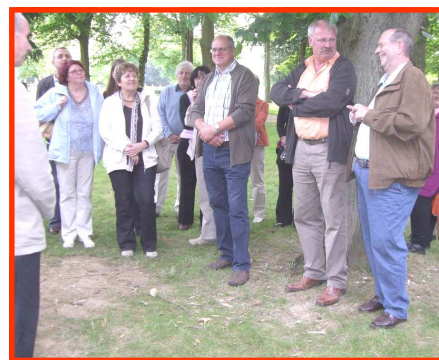
De droite à gauche :

Visite des Allemands de BESSENBACH du 27 au 29 juin 2008